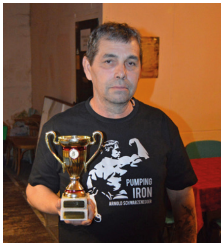
Nejlepší hráč Staříčského bowling klubu v roce 2024.

V pravidelných soutěžích jsme odehráli 18 turnajů a v nich 82 utkání. Jen ty výsledky